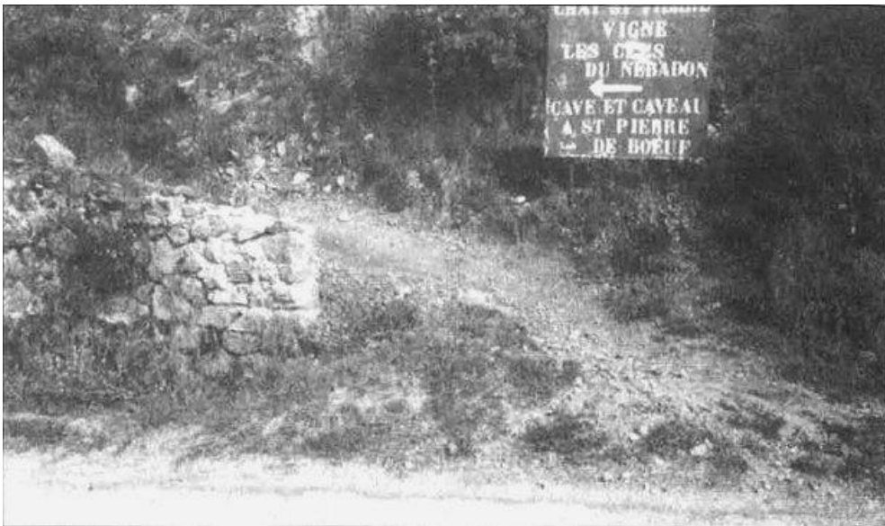
Parc naturel régional du Pilat 01/01/1993