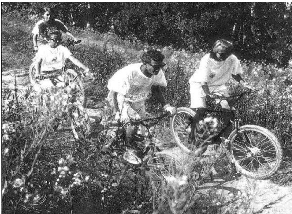
Parc naturel régional du Pilat 01/01/1993