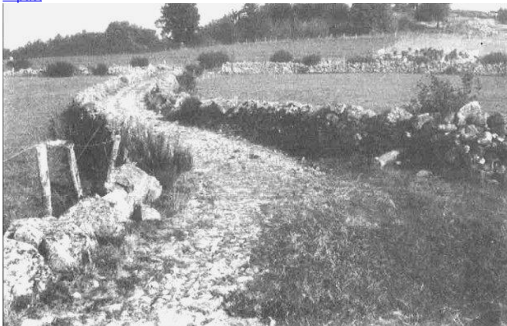
Parc naturel régional du Pilat